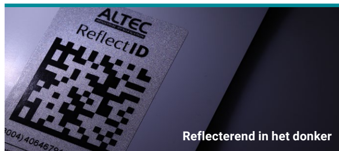
Reflecterend in het donker